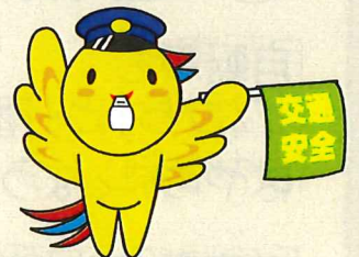
兵庫県マスコット はばたん