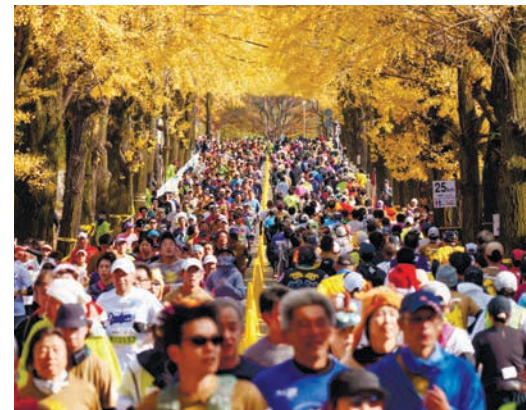
天理市役所前の銀杏並木