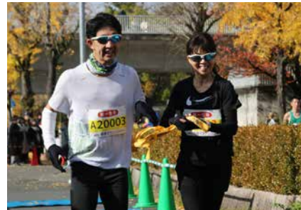
ベアリレーマラソンでタスキリレー

※ランナーが走行中は、自動車の通行や横断はできません(緊急自動車を除く)。歩行者は、歩道橋、地下通路を利用して横断するか、または大会関係者の指示に従って横断してください(バイク(エンジンを切って)、自転車は押して横断して下さい)。コース上では大会前の駐車・停車をご遠慮ください。 ※規制時間・規制区間は予定であり、変更されることがあります。 ※交通規制の変更にご理解とご協力のほどよろしくお願いします。