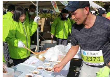
名物のぜんざいの振る舞いは大人気