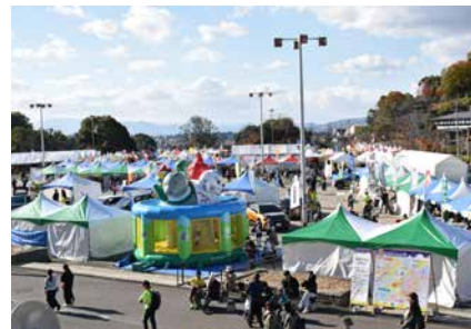
EXPOは2日間多くの来場者で賑わった