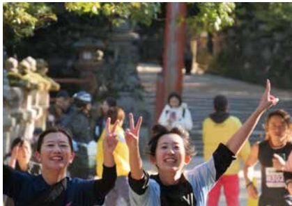
カメラに向かってポーズをとるランナー