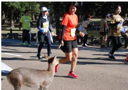
鹿と出会うのも奈良マラソンならではの