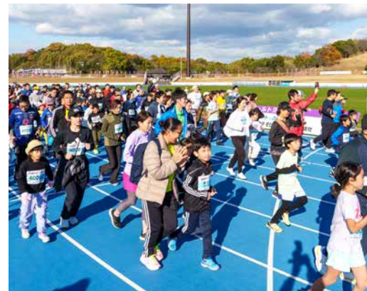
ミニ奈良マラソンには多くの小学生も参加