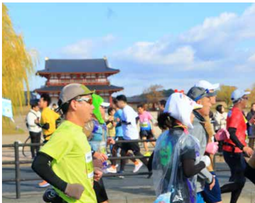
平城宮跡前を走るランナー