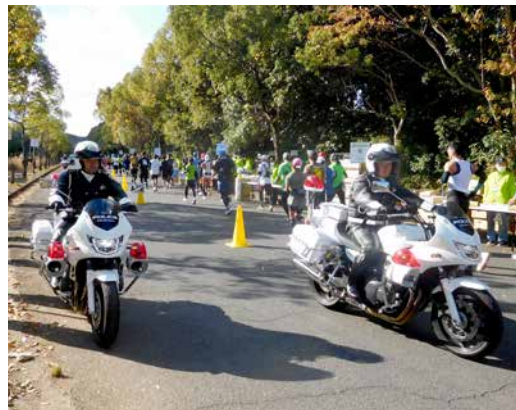
奈良県警白バイ隊が先導