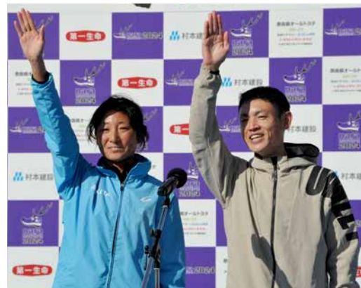
選手宣誓する2023年の優勝者