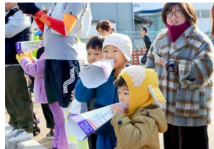
ランナーに声援を送る子供たち