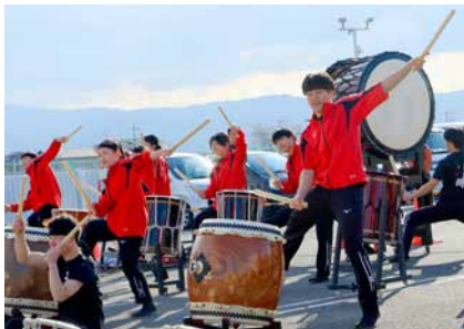
和太鼓演奏でランナーを応援