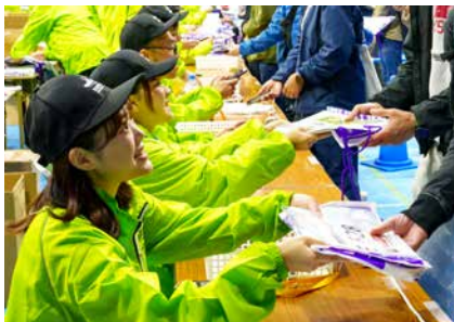
笑顔でランナー対応するボランティア